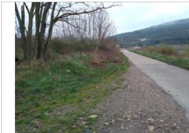
Bord de chemin