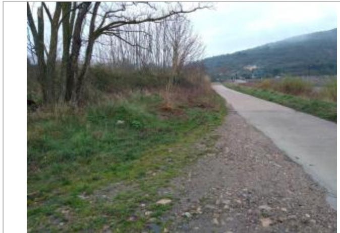
Bord de chemin

Coordonnées WGS84 : X: 3.12050450 / Y: 43.61615770