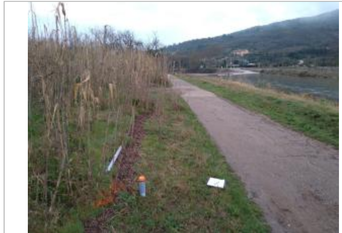
Bord de chemin

Coordonnées WGS84 : X: 3.12011800 / Y: 43.61550130