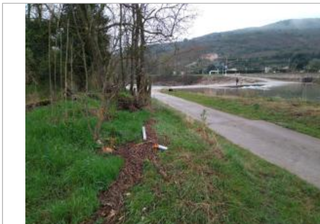
Bord de chemin

Coordonnées WGS84 : X: 3.11992370 / Y: 43.61499770