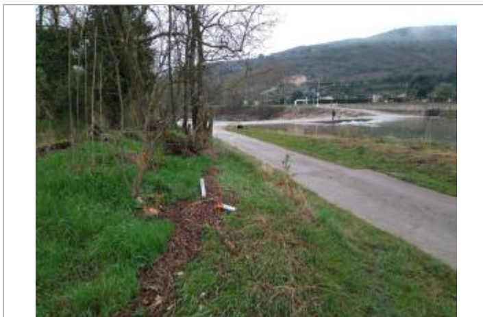
Bord de chemin