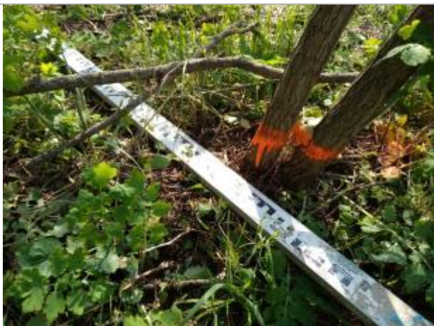
Dépôt en haut de berge

Altitude calculée de l'eau (en m) : 182.39 m