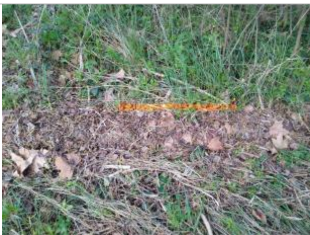
Dépôt en berge

Altitude calculée de l'eau (en m) : 180.12 m