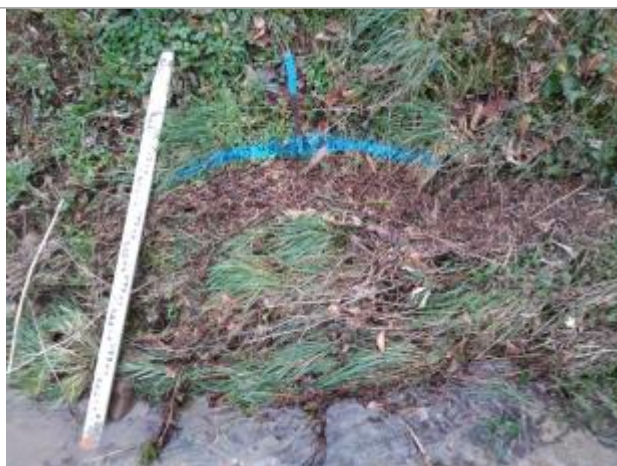
Dépôt contre le talus