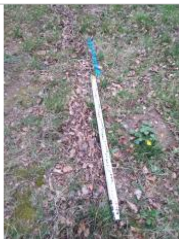
Dépôt en haut de berge