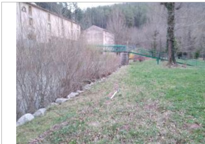
Haut de berge

Coordonnées WGS84 : X: 3.10089380 / Y: 43.75706210