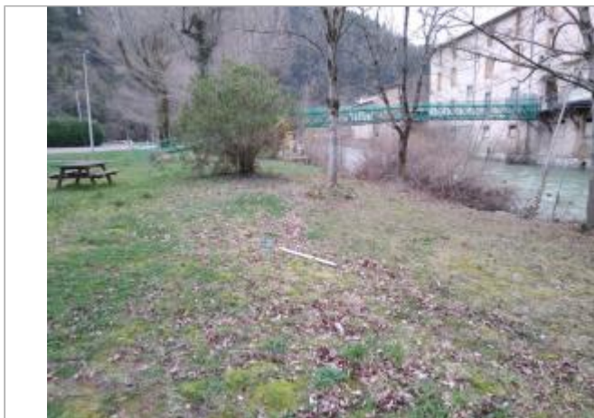
Prairie de rive