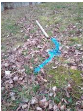
Dépôt sur l'herbe