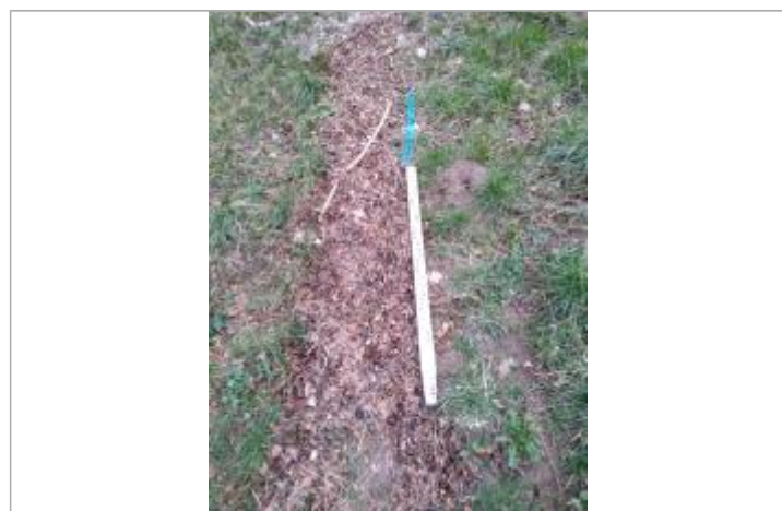
Dépôt sur le sentier