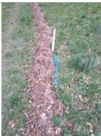
Dépôt au bord du sentier

Altitude calculée de l'eau (en m) : 362.72 m