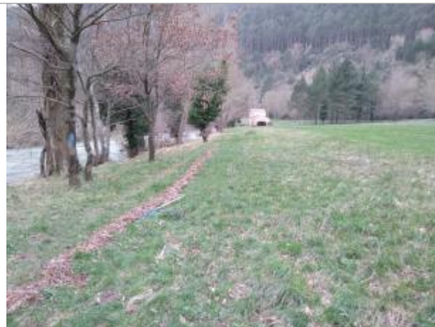
Sentier de berge