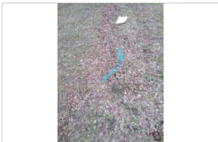
Dépôt en berge

Altitude calculée de l'eau (en m) : 349.9 m