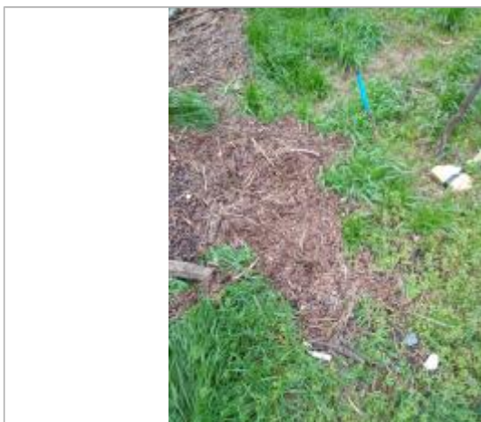
Dépôt dans le potager