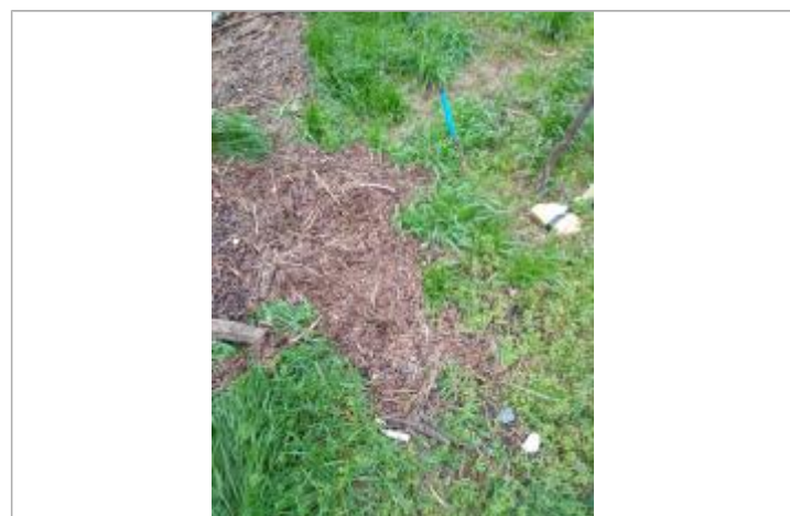
Dépôt dans le potager