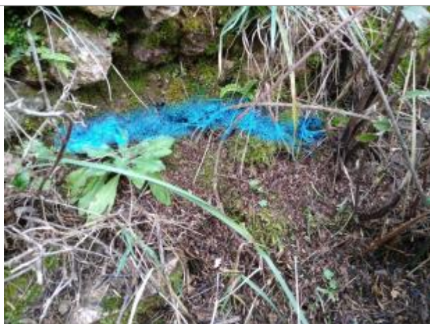
Dépôt en berge