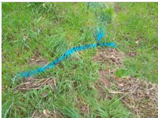
Dépôt dans l'herbe

Altitude calculée de l'eau (en m) : 277.4 m