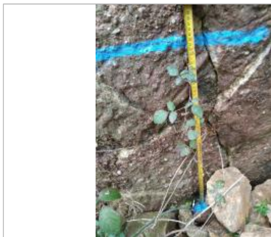
Trace sur la culée