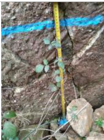
Trace sur la culée