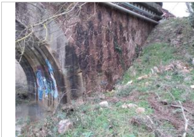
Culée du pont