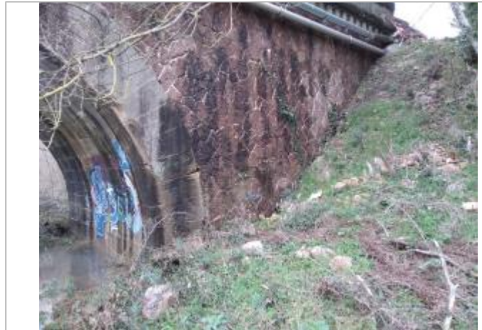
Culée du pont