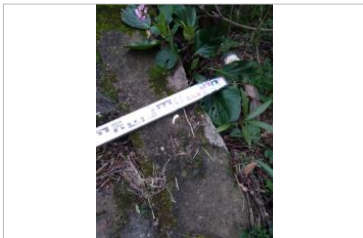
Dépôt dans les escaliers