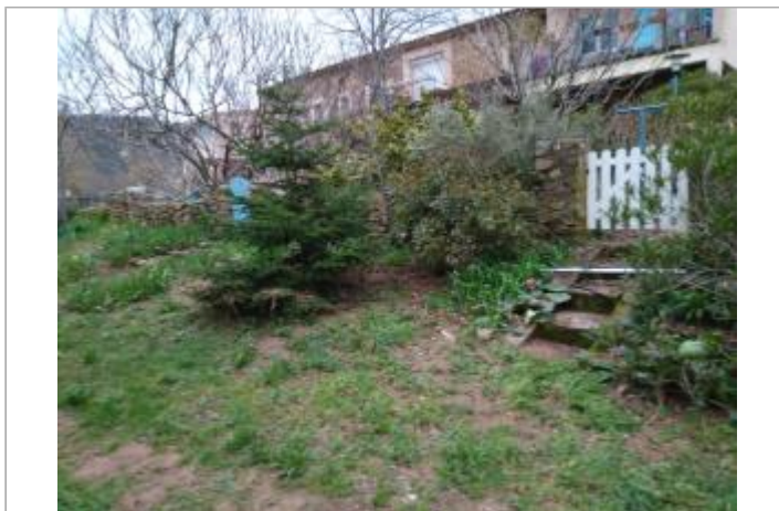
Escaliers du jardin