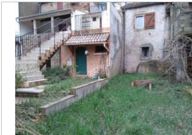
Muret du jardin