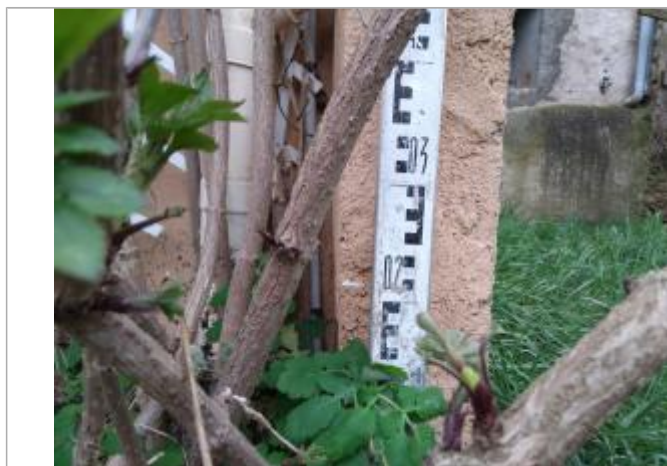
Trace sur le muret