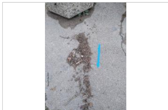
Dépôt sur la chaussée