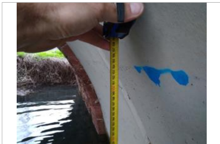
Trace sous l'arche

Altitude calculée de l'eau (en m) : 250.408 m