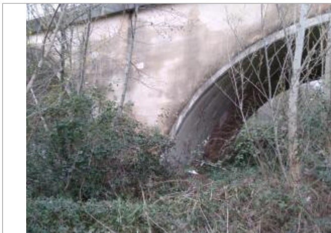
Troisième arche du pont