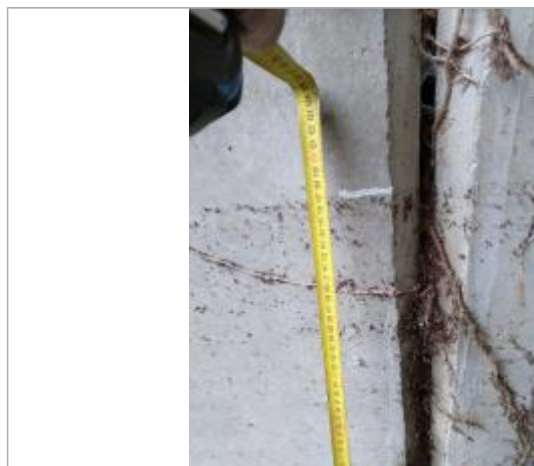
Trace dans l'arche

Altitude calculée de l'eau (en m) : 250.19 m