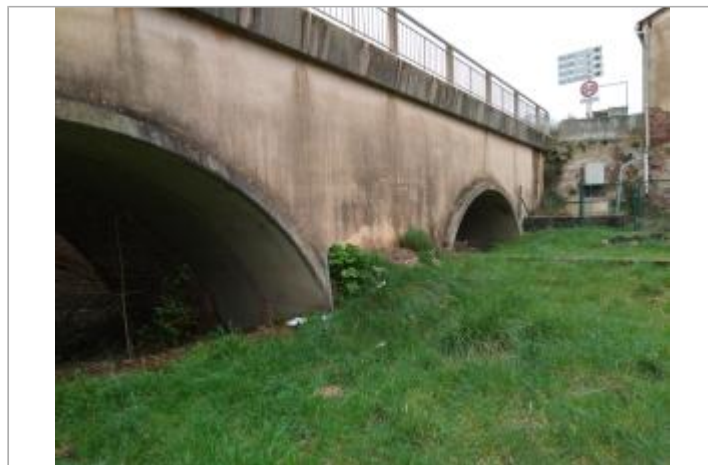
Deuxième arche du pont

GÉOLOCALISATION Coordonnées WGS84 : X: 3.16896080 / Y: 43.69969380 Coordonnées RGF93 (Lambert 93) X: 713623.1 / Y: 6288977 Coordonnées RGF93 (ETRS89) : X: 3.1689608 / Y: 43.6996938 Code Hydro: Y25-0400 Rive de référence: Gauche