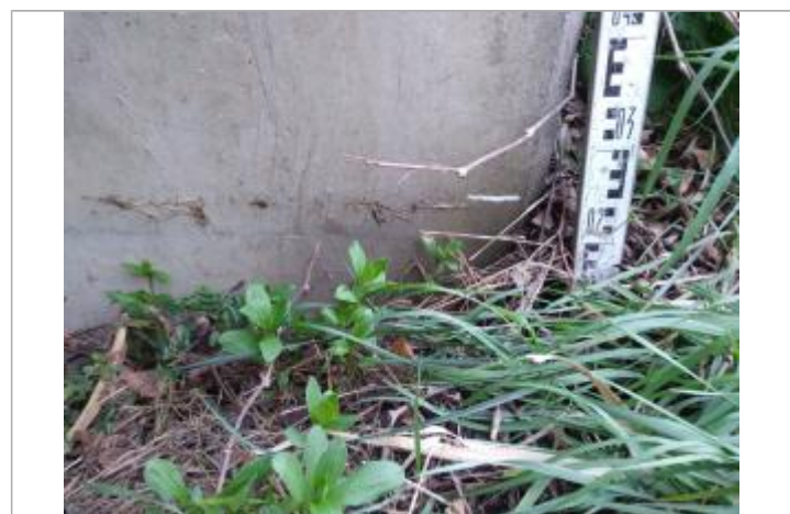
Trace dans l'arche

GÉNÉRAL Code : 23_ORB22_R_632_1 Date de mise à jour : 26/04/2023 Auteur : SPC MO