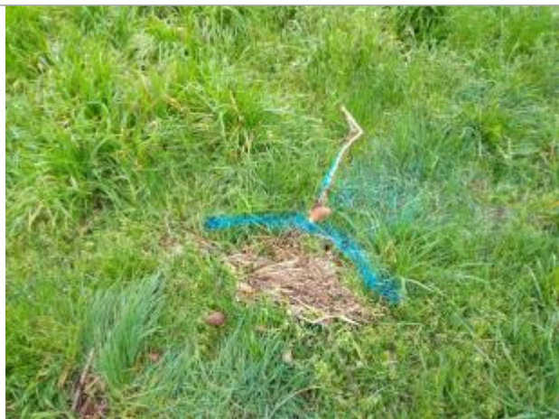
Dépôt dans l'herbe

Altitude calculée de l'eau (en m) : 249.97 m