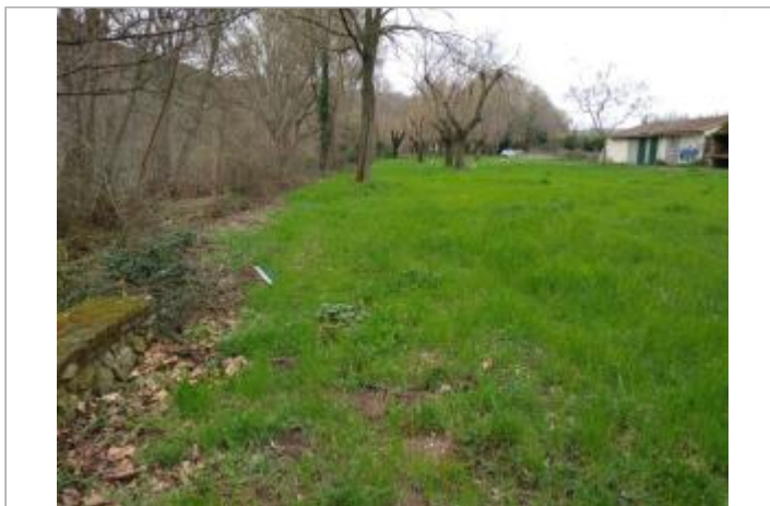
Haut de berge