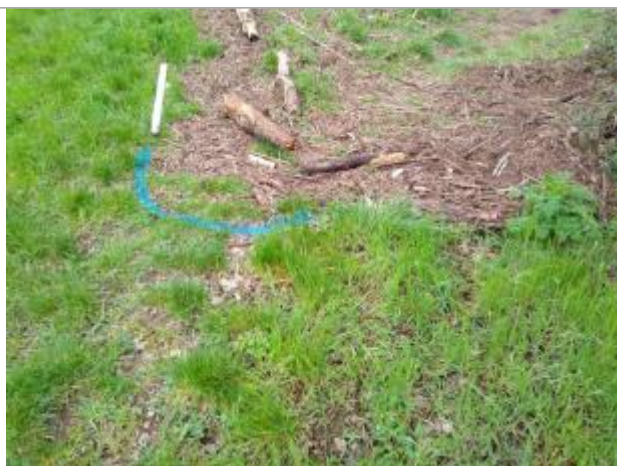
Dépôt en haut de berge

Altitude calculée de l'eau (en m) : 246.95 m