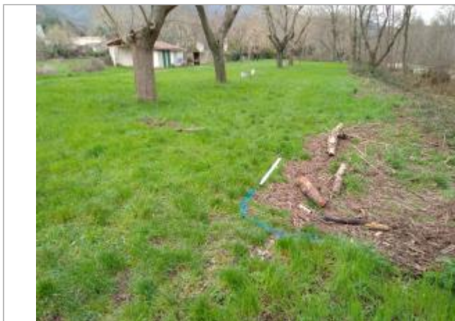
Haut de berge

Coordonnées WGS84 : X: 3.17039130 / Y: 43.69317680