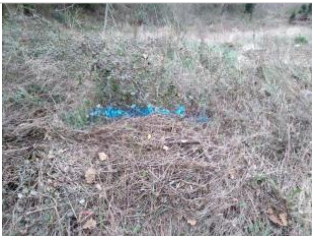
Débris végétaux dans les ronces

Altitude calculée de l'eau (en m) : 245.97 m