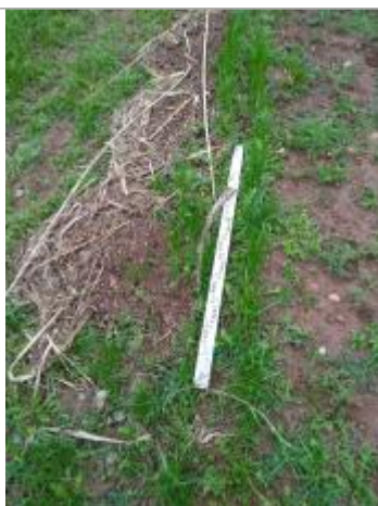
Dépôt au sol