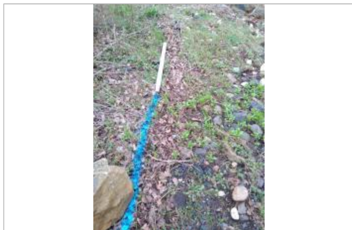
Dépôt en berge