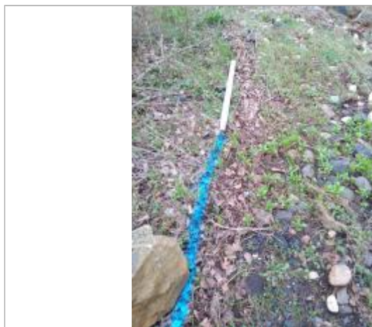
Dépôt en berge