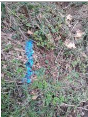
Dépôt en berge

Altitude calculée de l'eau (en m) : 238.05 m