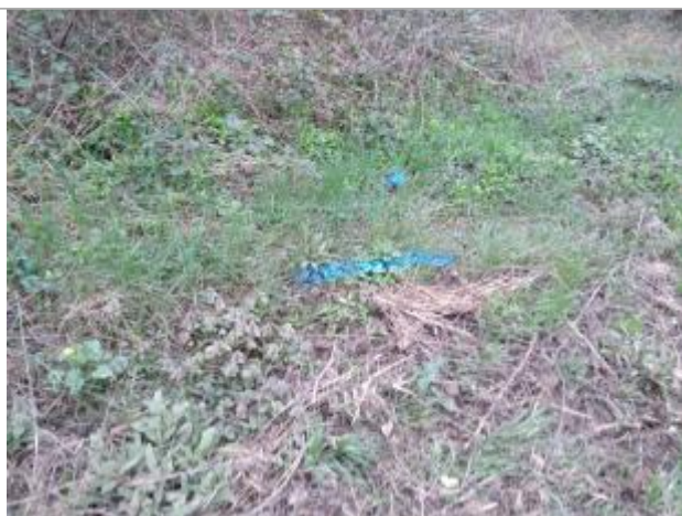
Dépôt dans l'herbe