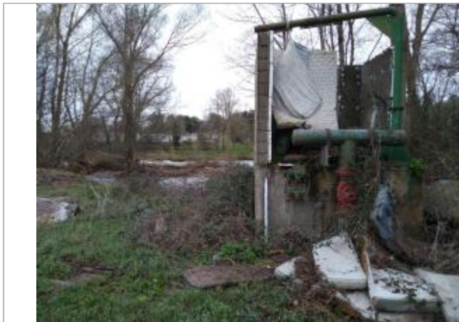
Station de pompage