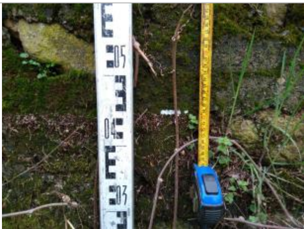
Trace sur le muret

Altitude calculée de l'eau (en m) : 234.437 m