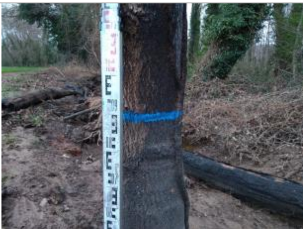
Trace sur l'écorce

Altitude calculée de l'eau (en m) : 233.46 m