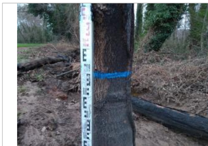
Trace sur l'écorce

Code : 23_ORB22_R_603_1 Date de mise à jour : 26/04/2023 Auteur : SPC MO