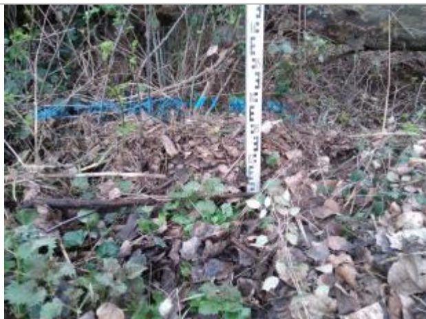
Dépôt dans les ronces

Altitude calculée de l'eau (en m) : 233.33 m