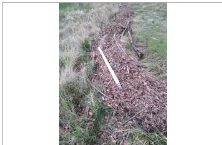
Dépôt dans l'herbe

Altitude calculée de l'eau (en m) : 227.11 m