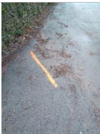
Dépôt sur la route