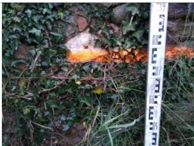
Trace dans le lierre