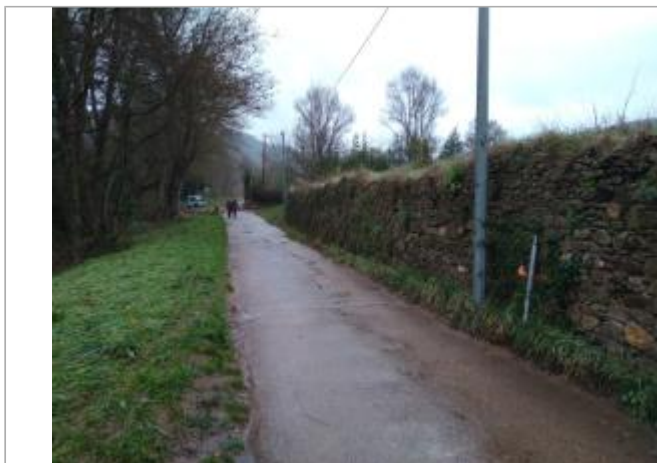
Mur de soutènement