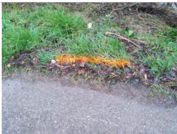
Dépôt en bord de route