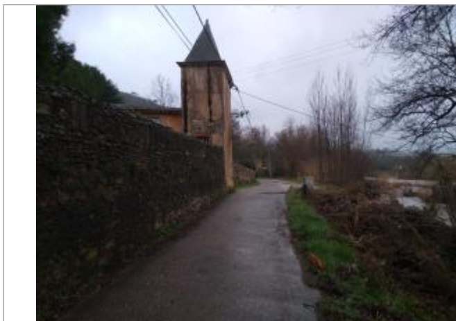
Bord de route

Coordonnées WGS84 : X: 3.16591870 / Y: 43.62698520