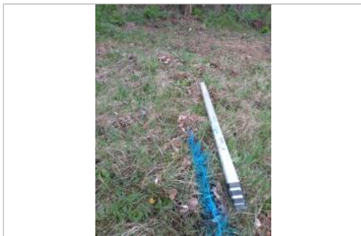
Dépôt dans l'herbe

Altitude calculée de l'eau (en m) : 198.46 m