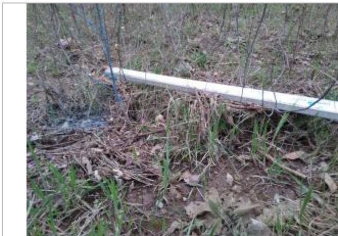
Dépôt dans l'herbe