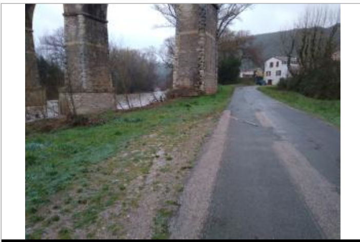
Bord de route

GÉOLOCALISATION Coordonnées WGS84 : X: 3.16384410 / Y: 43.62140970 Coordonnées RGF93 (Lambert 93) X: 713228.6 / Y: 6280275.99 Coordonnées RGF93 (ETRS89) : X: 3.1638441 / Y: 43.6214097 Code Hydro: Y25-0400 Rive de référence: Gauche