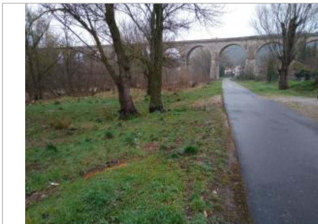
Bord de route

Coordonnées WGS84 : X: 3.16275740 / Y: 43.62079950