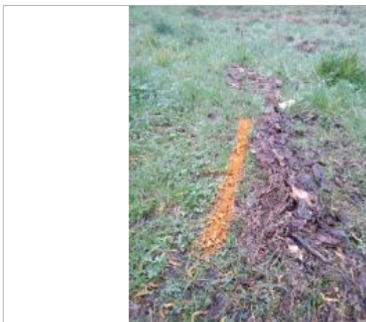
Dépôt au sol