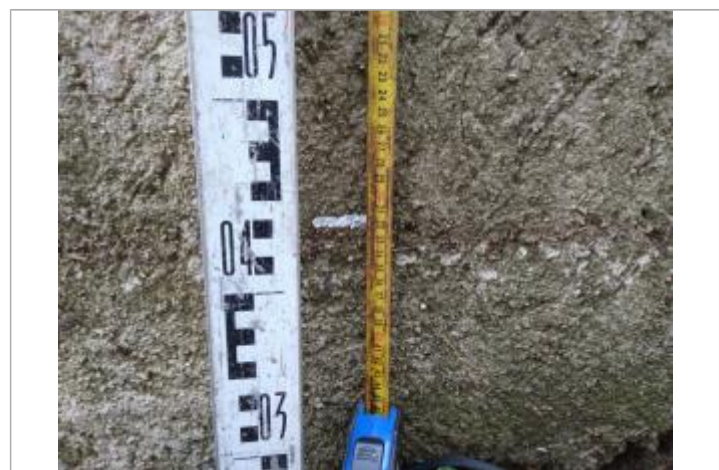
Trace sur le muret

GÉNÉRAL Code : 23_ORB22_R_561_1 Date de mise à jour : 26/04/2023 Auteur : SPC MO