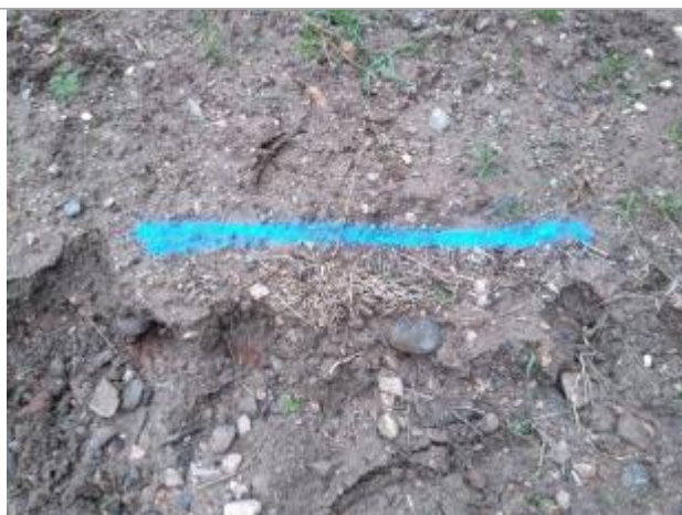
Dépôt sur le talus et ligne d'érosion

Altitude calculée de l'eau (en m) : 194.9 m