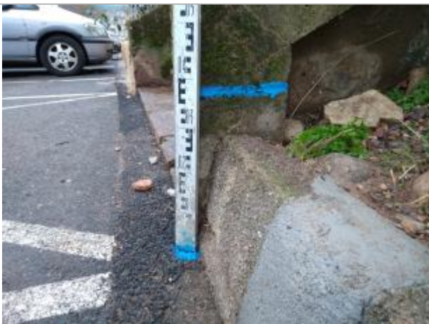
Trace sur la rampe

Altitude calculée de l'eau (en m) : 194.75 m