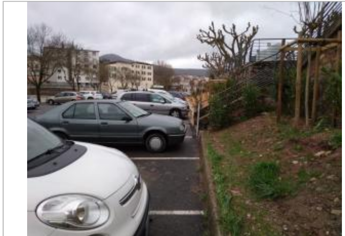
Rampe en béton