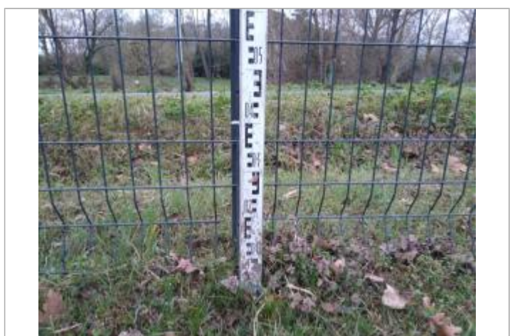
Trace dans le profilé

GÉNÉRAL Code : 23_ORB22_R_528_1 Date de mise à jour : 26/04/2023 Auteur : SPC MO