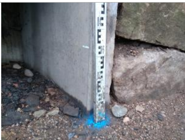
Trace sous le barbecue

Altitude calculée de l'eau (en m) : 191.53 m