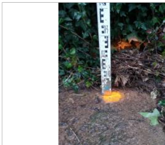
Dépôt contre le mur