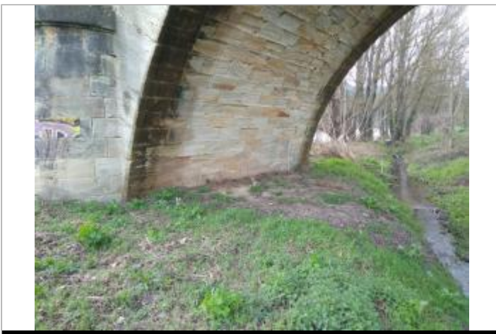
Arche du pont

GÉOLOCALISATION Coordonnées WGS84 : X: 3.11936640 / Y: 43.58997580 Coordonnées RGF93 (Lambert 93) X: 709642.8 / Y: 6276776 Coordonnées RGF93 (ETRS89) : X: 3.1193664 / Y: 43.5899758 Code Hydro: Y25-0400 Rive de référence: Droite