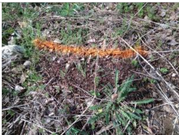
Dépôt en berge

Altitude calculée de l'eau (en m) : 177.63 m