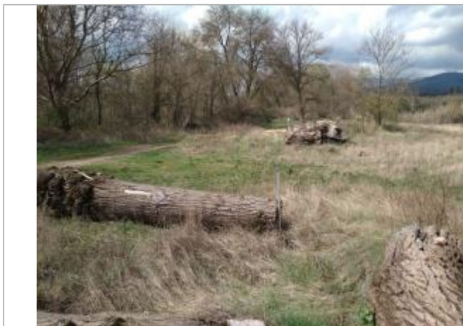
Bille de peuplier

Coordonnées WGS84 : X: 3.10628920 / Y: 43.58786590