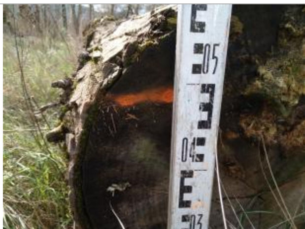
Trace sur une bille de bois